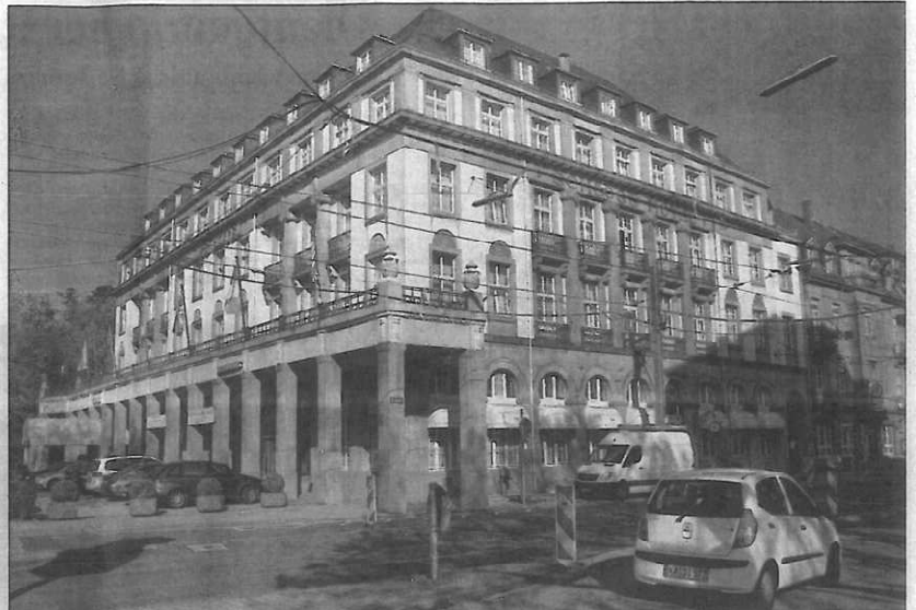
HAUS MIT GESCHICHTE: Das Schlosshotel wird im nächsten Jahr 100 Jahre alt. Zu Glanzzeiten der Bambi-Verleihung zwischen 1954 und 1964 logierten auch zahlreiche Weltstars wie Sophia Loren oder Rock Hudson in der Herberge.

In Karlsruhe wurden allerdings schon vor dem Bau des Schlosshotels die Weichen für eine Förderung des Tourismus gestellt. Bereits im Jahr 1906 hatten Stadträte und Hoteliers den Verein zur Förderung des Fremdenverkehrs gegründet, der Vorläufer der heutigen